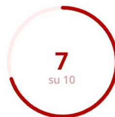
Gradimento del Materiale Didattico