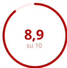
Gradimento della Modalità Erogativa