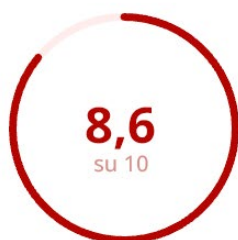
Soddisfazione del Corpo Docente