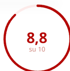
Soddisfazione della Parte Esperenziale