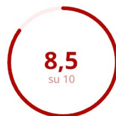
Gradimento del Materiale Didattico