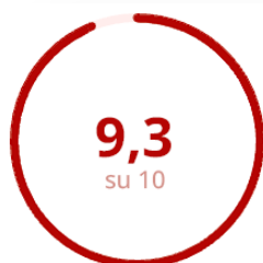
Gradimento della Modalità Erogativa