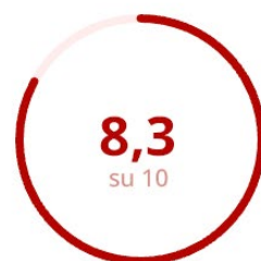
Gradimento del Materiale Didattico