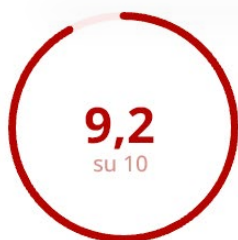
Gradimento della Modalità Erogativa