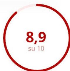
Soddisfazione della Parte Esperenziale