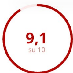
Gradimento della Modalità Erogativa