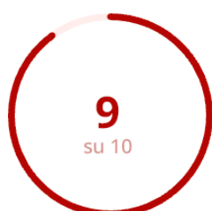
Soddisfazione del Corpo Docente