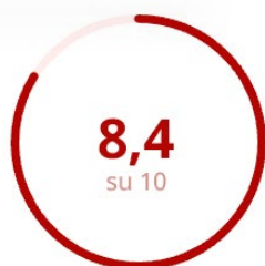
Soddisfazione della Parte Esperenziale