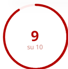
Gradimento della Modalità Erogativa