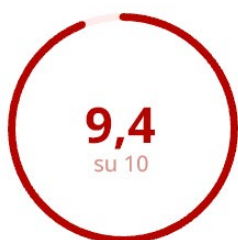
Soddisfazione del Corpo Docente