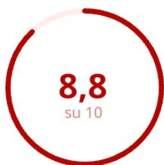
Soddisfazione del Corpo Docente