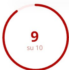
Gradimento della Modalità Erogativa