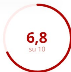
Soddisfazione della Parte Esperenziale