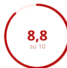
Gradimento del Materiale Didattico