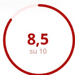
Soddisfazione della Parte Esperenziale