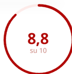
Soddisfazione della Parte Esperenziale