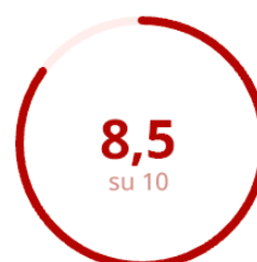
Gradimento del Materiale Didattico