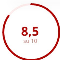
Gradimento della Modalità Erogativa